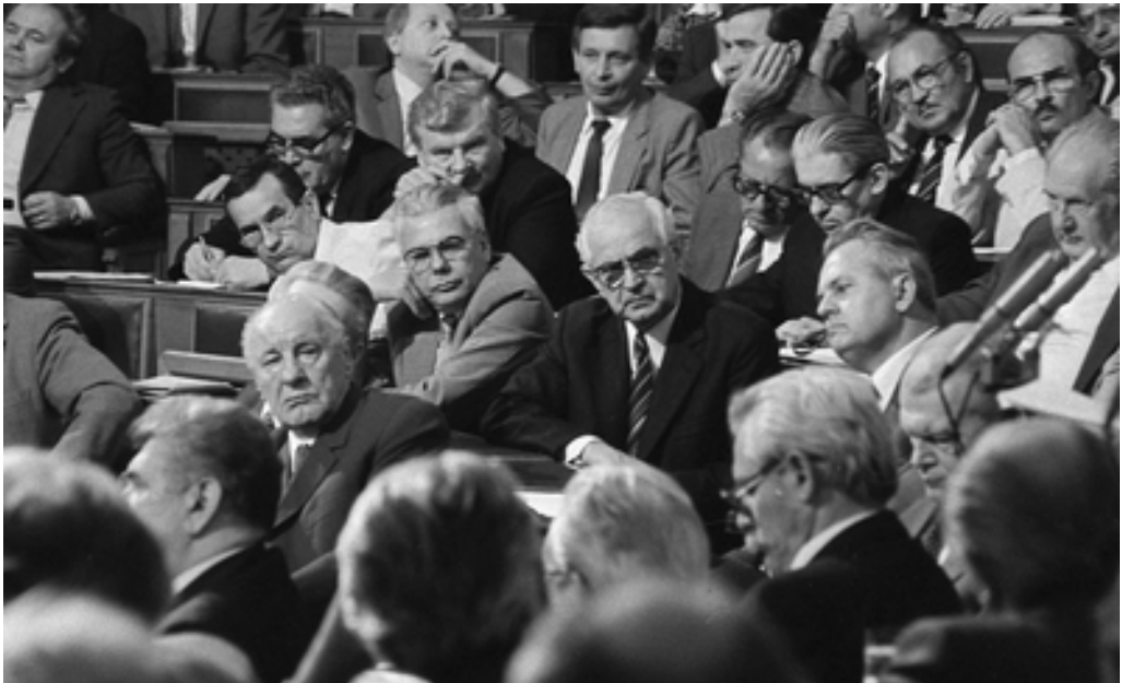
1. kép Móra Ferenc Múzeum Fotógyűjtemény Enyedi Zoltán-hagyaték. (MFM-E 943/10)

Kádár haragosan rémült tekintete és a bukás előszele