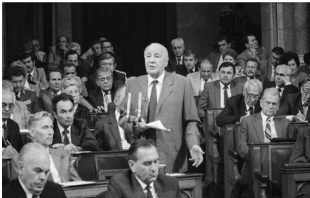
4. kép Kádár János utolsó parlamenti beszéde közben, 1987. szeptember 16-án. (MFM-E 95011)

Az ország nyilvánossága a televíziós összefoglalóból értesült Kádár János beszédéről. A közvélemény ekkor szembesülhetett azzal, Kádár János elvesztette a realitásérzékét, képességét az irányításra, a kibontakozó válsághelyzet elemzésére.