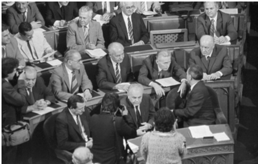
2. kép A parlamenti bársonyszékekben (balról jobbra): Maróthy László miniszterelnök-helyettes, Németh Károly, az Elnöki Tanács elnöke és Grósz Károly kormányfő (hátra tekintve). A második sorban (jobbról balra): Kádár János, az MSZMP főtitkára, Lázár György, az MSZMP főtitkárhelyettese, Gáspár Sándor, a SZOT elnöke, Óvári Miklós, az MSZMP KB irodavezetője és Havasi Ferenc, az MSZMP budapesti első titkára. (1987. június 25.). (MFM-E 94325)

Kádár János 1987. június 25-én délelőtt úgy ülhetett be az országgyűlési szék-sorokba, hogy a korábbi hónapokban a maga elé kitűzött hatalomtechnikai feladatot elvégezte: végrehajtott egy komolyabb vezetőcserét, de mindez az ő pozícióját nem érintette, így reálisan számolhatott azzal, hogy 1990-ig, a következő pártkongresszus idejéig, hivatalban marad. A változások legfontosabb eleme az volt, hogy a markánsan balos, „revizionista-faló” 3 imázssal bíró budapesti első titkár, Grósz Károly lett a kormányfő a posztot 12 éven át betöltő Lázár György után. A magyar és a külföldi nyilvánosság számára mindez azt üzenete, Magyarországon politikai mozgások indultak el, de Kádár szilárdan áll a gáton. Király Zoltánnak a közpolitikai felelősséget firtató felvetése ebbe az összképbe rondított bele.