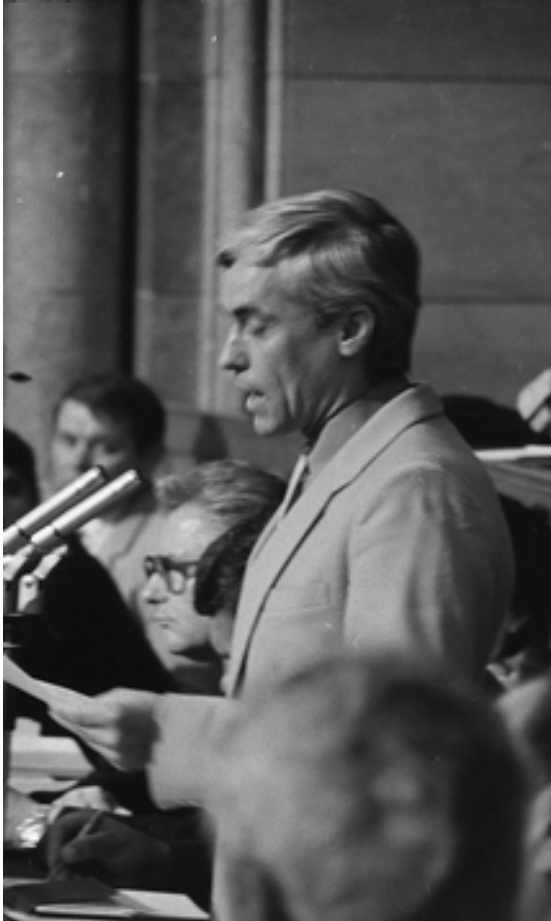
3. kép Király Zoltán országgyűlési képviselő beszédet mond a parlamentben 1987. június 25-én. (MFM-E 943/1)

Király Zoltán 1985-ben meglepetésre legyőzte az országgyűlési képviselőválasztáson a hírhedt Komócsin Mihályt, a Csongrád megyei pártbizottság egykori első titkárát, aki évtizedeken keresztül Szeged meghatározó közéleti tényezője volt. „Az 1985-ös országgyűlési választások előtt Komócsin Mihály megyei első titkár képviselői jelölőgyűlésére voltunk hivatalosak. Itt jutott eszembe, hogy már nyitva áll a lehetőség a közvetlen, kettős jelölésre. – Miért is ne tennénk próbát, mondjuk a képernyőről ismert Király Zoltán kollégámmal? – jutott eszembe váratlanul. – Így is tettünk. Spontán előterjesztésünktől a levezető elnök alaposan elképedt, de a kezdeményezés egyetértésre talált az odatoborzott közönség soraiban. A jelölőgyűlés a meglepett riportert többséggel meg is szavazta. Így lett Király Zoltán, a körzeti stúdió pártalapszervezetének akkori titkára a Parlament képviselője” 30 – emlékezik az örkényi egypercesekért kiáltó abszurd helyzetre Pavlovits Miklós egykori tévériporter.