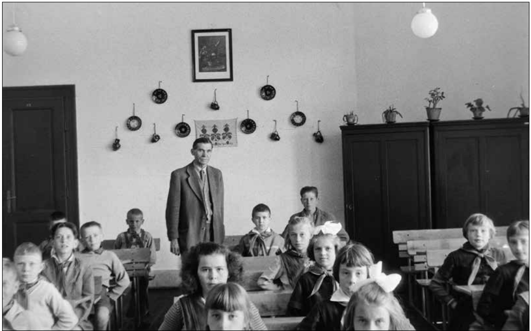
Iskolai osztálykép, 1961.