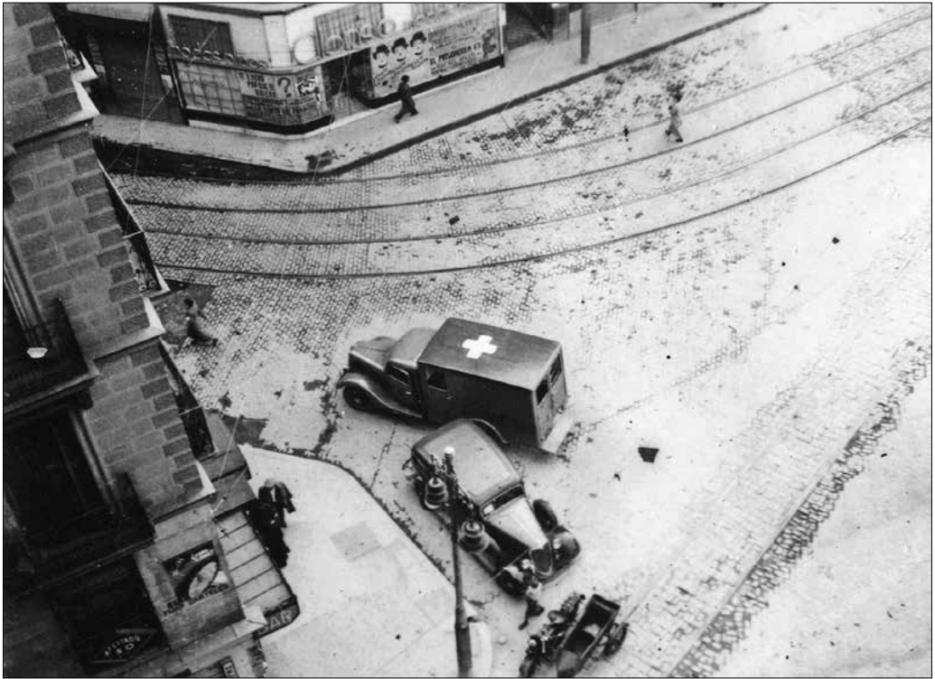
Kilátás a Plaza del Callao-ra, szemben a Calle de Preciados torkolata, Madrid, Spanyolország, 1937.