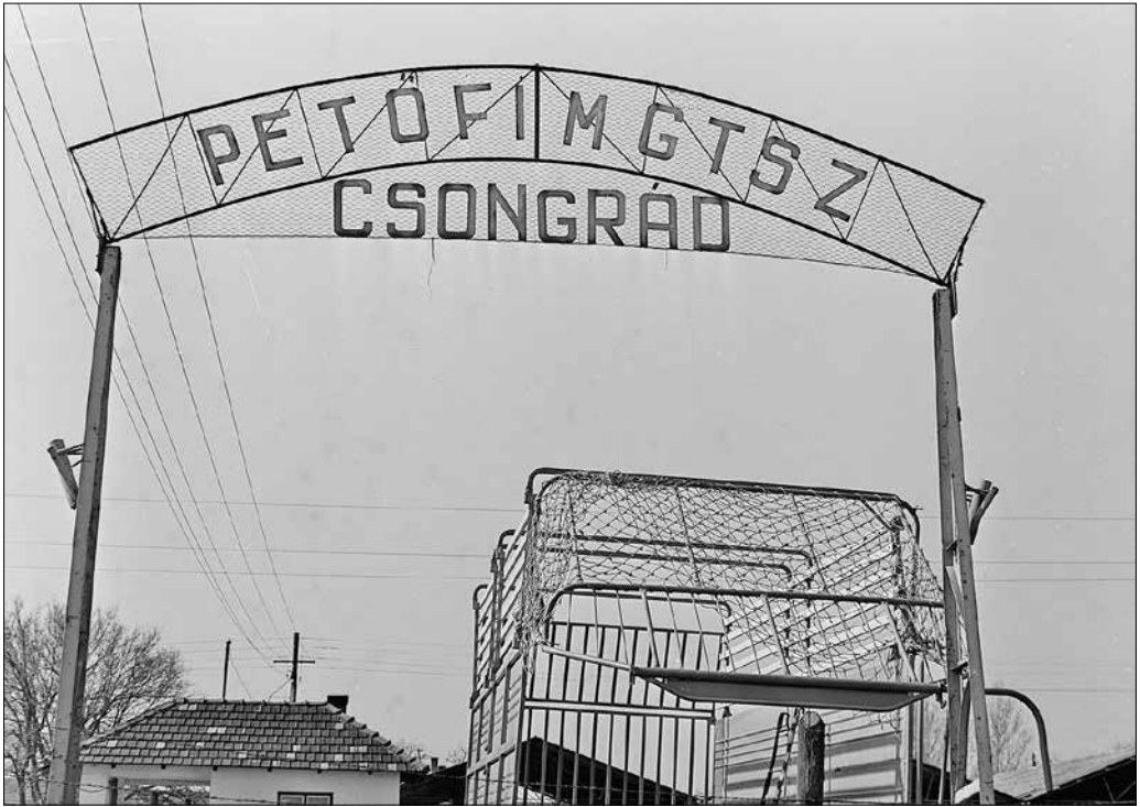
Csongrád megyei Tsz., 1970.