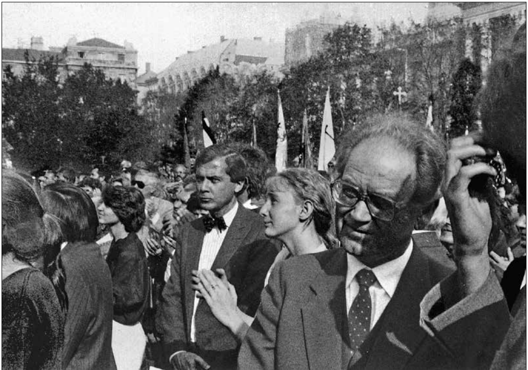
Kossuth Lajos tér október 23-án, a köztársaság kikiáltása idején. Középen csokornyakkendővel Mark Palmer amerikai nagykövet, jobbra Borisz Sztukalin szovjet nagykövet. Budapest, 1989.