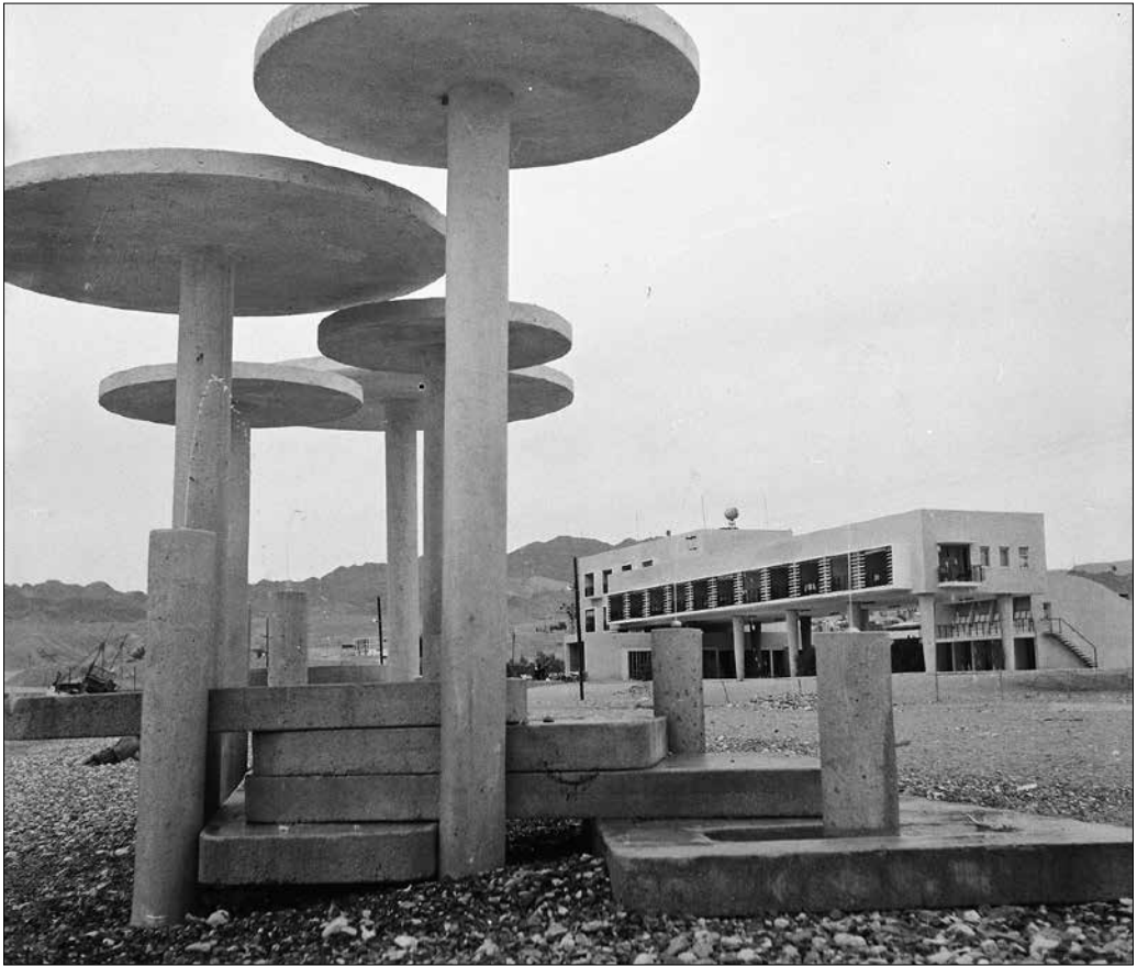
Tengerpart. Eilat, Izrael, 1964.