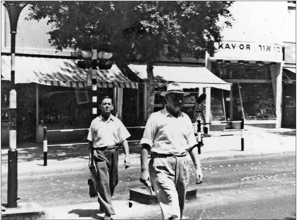
Járókelők Izraelben, 1960.