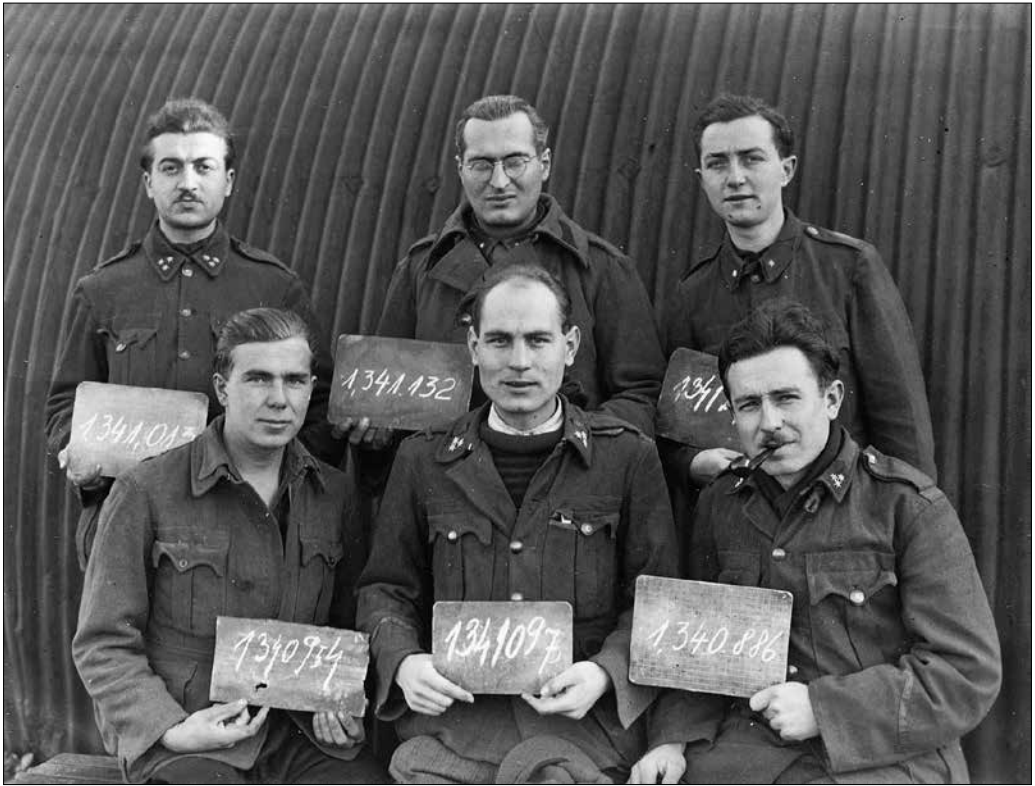
Hadifogoly katonák, 1945.