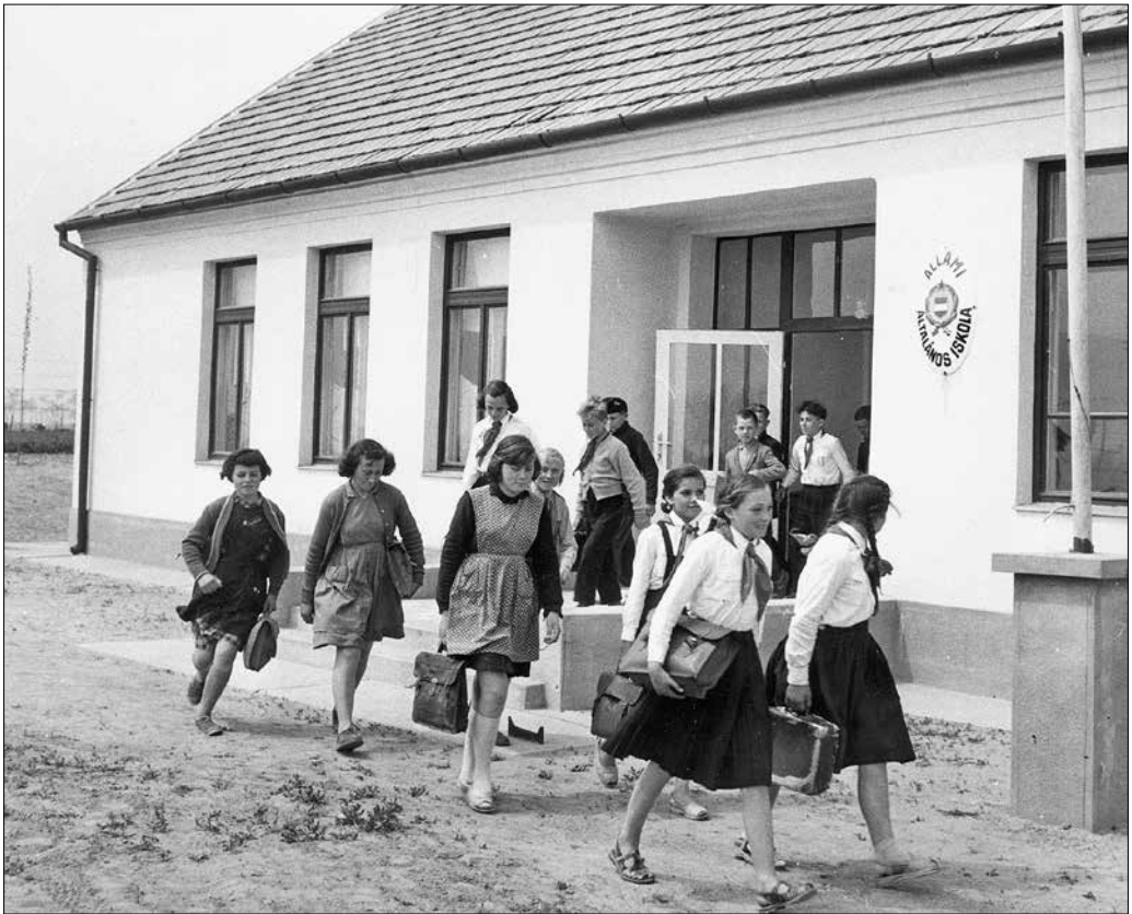
Kismindszenti út, tanyasi iskola. Kiskunfélegyháza, 1960.