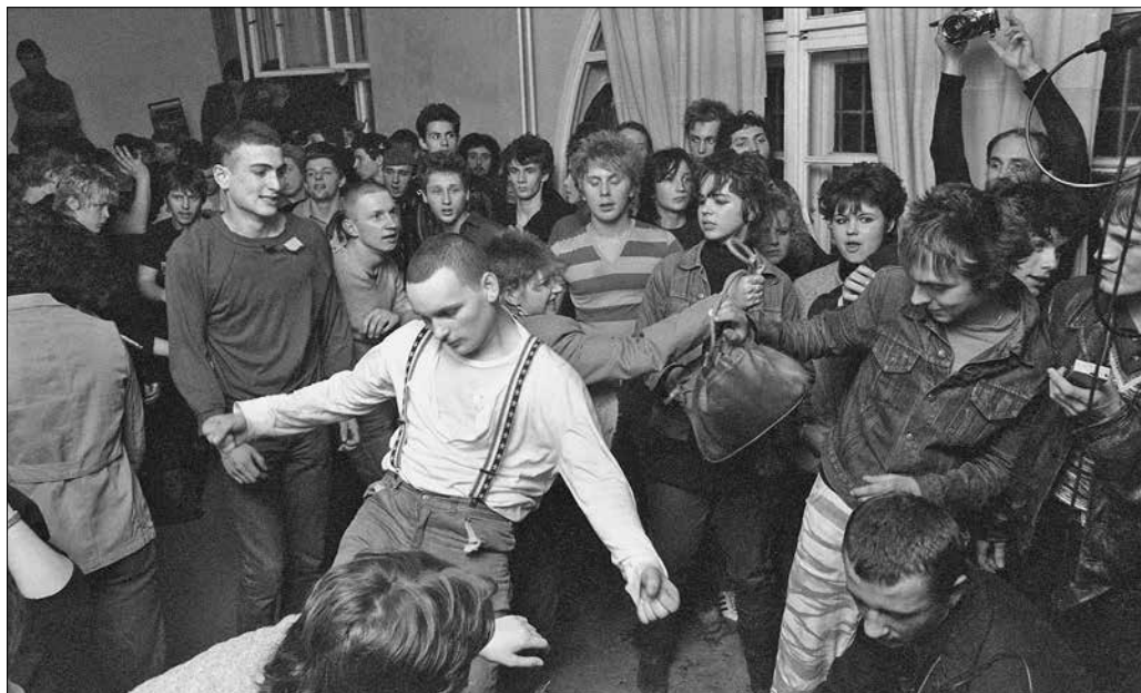
1. kép. A Kozák téri CPg-koncert közönsége