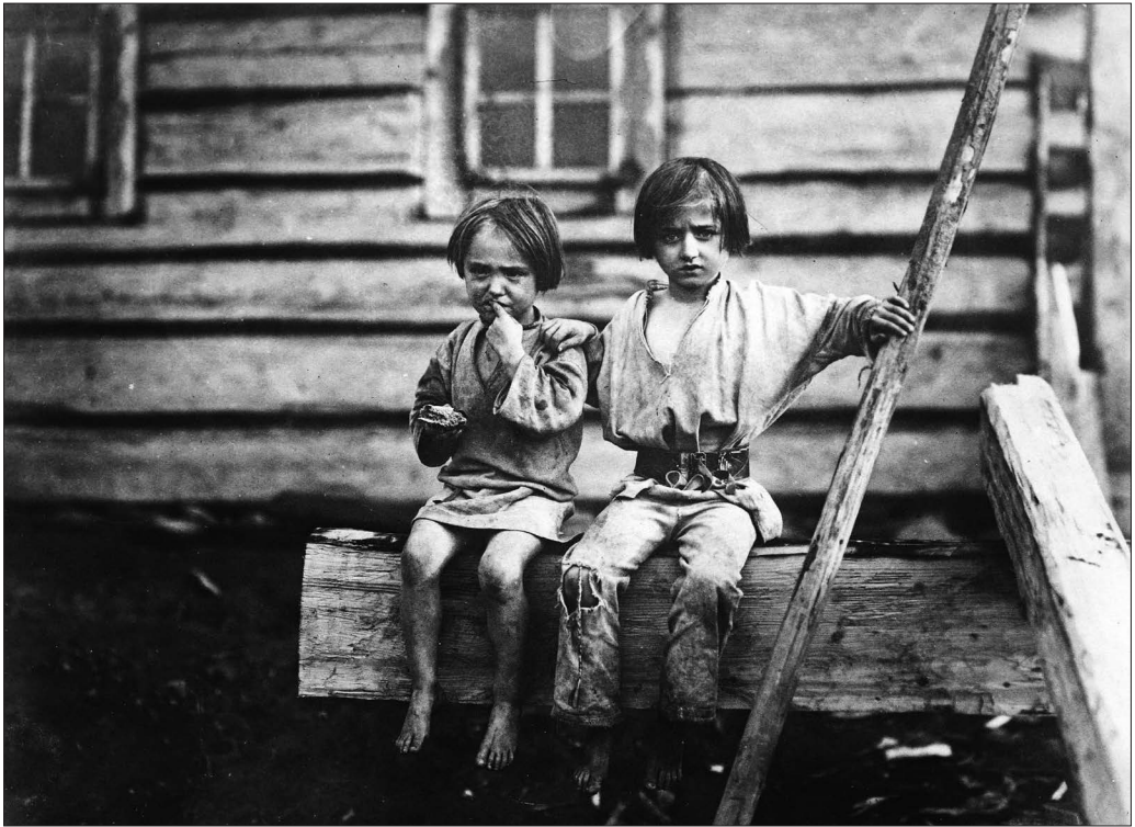
Mezőháti ruszin gyerekek, 1907