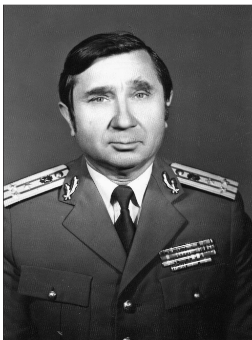
4. kép Gheorghe E. Rațiu ezredes 47

A BM I. Belső Hírszerzési Igazgatóságának 1989. évi első negyedéves, összegző jelentésében először szerepelt, hogy az országból történő eltávozások szervezett formában történnek, és külön hangsúlyozták, hogy a cselekményeket komoly társadalmi támogatottság jellemzi (ti. a határ menti településeken embercsempészeket vonnak be és idegen állampolgárok segítik őket). A jelentés megállapította, hogy a szökések megszervezésének konspiratív jellege növekedett (jelszó, titkos jelzések használata, kódolt telefonbeszélgetések, a cselekmények egyes szakaszaiban közvetítők használata anélkül, hogy azok ismernék a pontos tervet). Az I. Belső Hírszerzési Igazgatóság intézkedései között kiemelt szerepet kapott az idegen állampolgárok tevékenységének alapos dokumentálása és in flagranti tettenérése, hiszen úgy