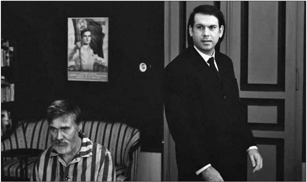
Jelenet a Ti is élni fogtok című filmből.