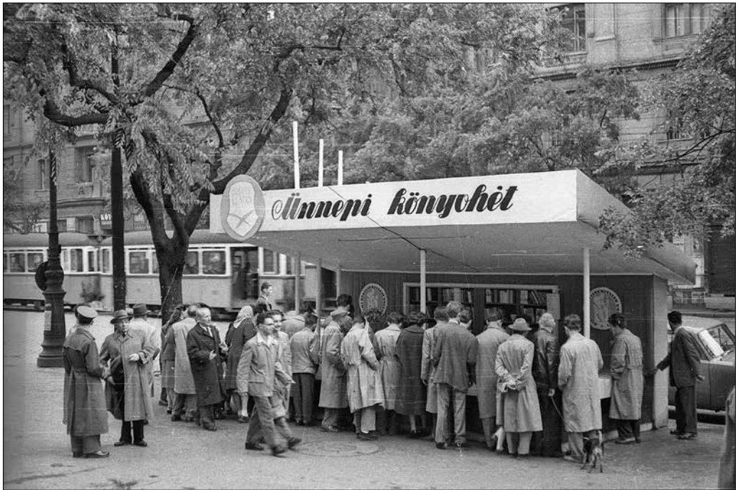
Szent István körút, az Ünnepi könyvhét pavilonja a Vígszínház (ekkor a Magyar Néphadsereg Színháza) előtt, 1958.