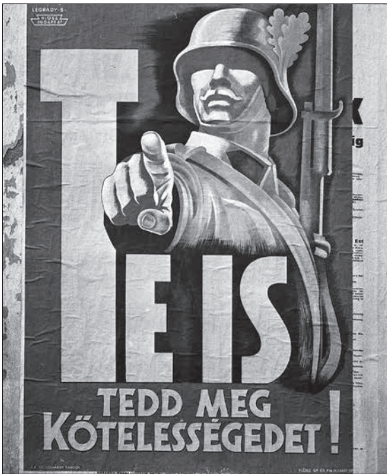
3. kép. 1942-ben Budapesten készült fotó, rajta Légrády Sándor Te is tedd meg kötelességedet! címfeliratú plakátja 43