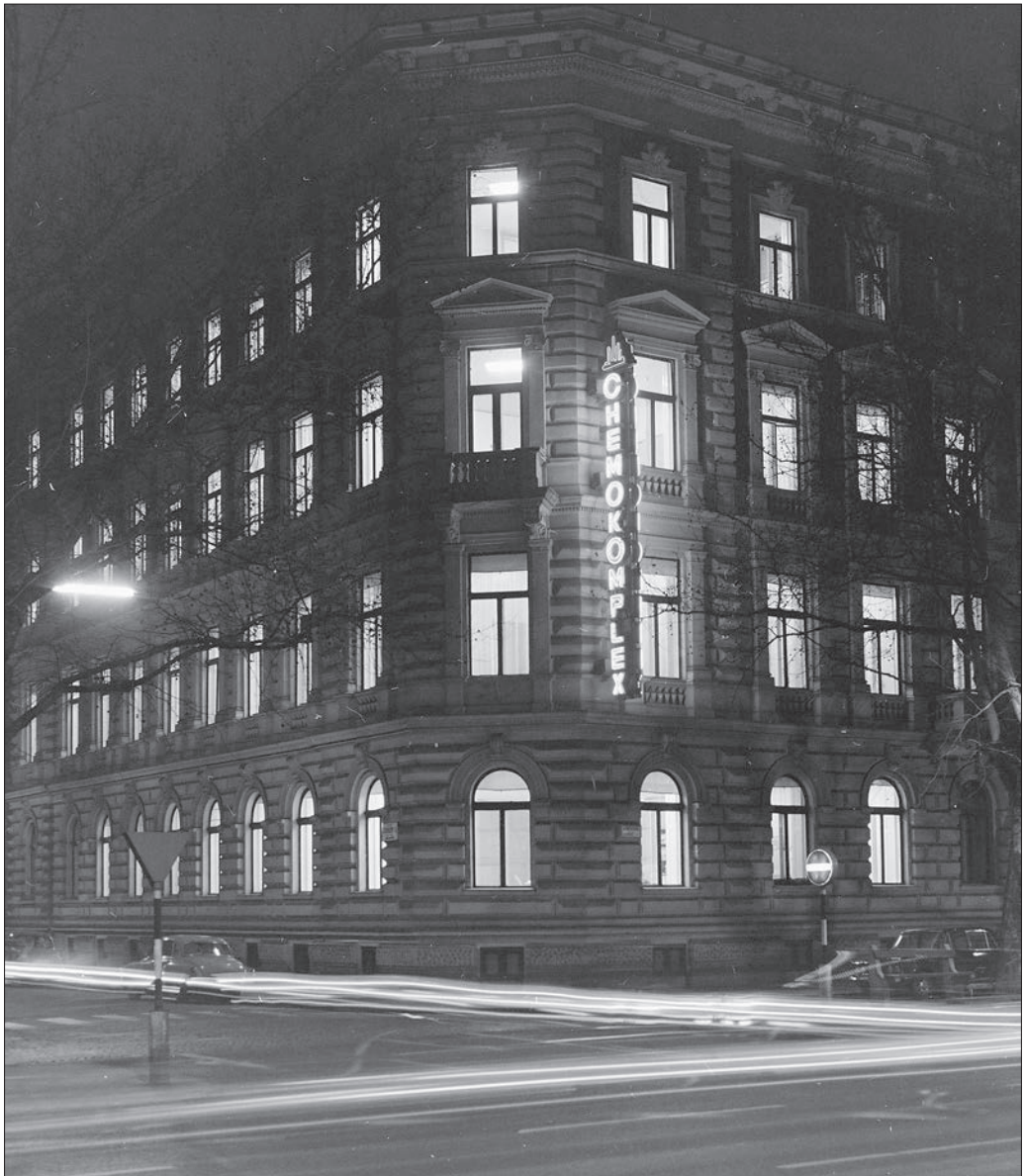
Budapest VI. Andrásy út (Népköztársaság útja) 60., a Csengery utca sarkon. CHEMOKOMPLEX székház, 1972.