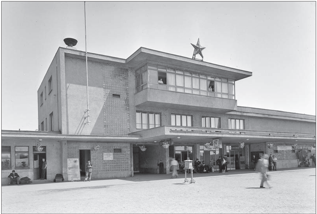
Nyíregyháza vasútállomás, 1959.